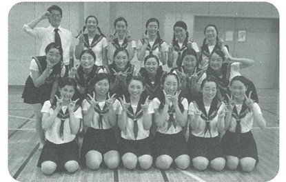
さいたまけんりつげいじゆつそうごうこうとうがっこう 埼玉県立芸術総合高等学校ダンス部 1年生12人、2年生7人、3年生7人で活動中。モダンダンスや創作ダンス、ジャズダンスなど幅広く踊っている。文化祭や地域のイベントでもたくさんのパフォーマンスを披露している。平成28年、第29回高校・大学ダンスフェスティバル神戸で決選出場。

2016 11/12(土)・13(日) 14:30開場 15:00開演 彩の国さいたま芸術劇場 小ホール