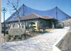
②キャンベルタウン野鳥の森