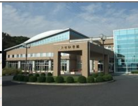
④いきいき館(市民プール)