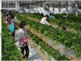
⑤越谷いちごタウン