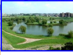
大吉調節池親水公園