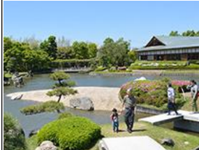
③花田第六公園 (日本庭園 花田苑)