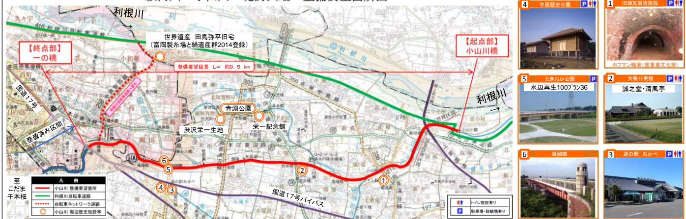
一級河川 小山川 堤防天端 整備要望箇所図