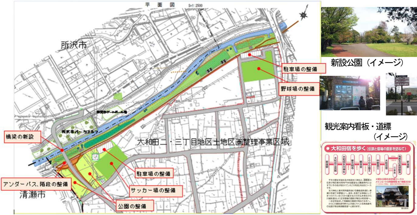
大和田宿を歩く ガイドツアー (イメージ)