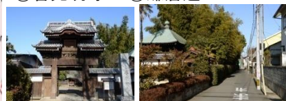
⑦大和田宿 ⑧鬼鹿毛馬頭観音