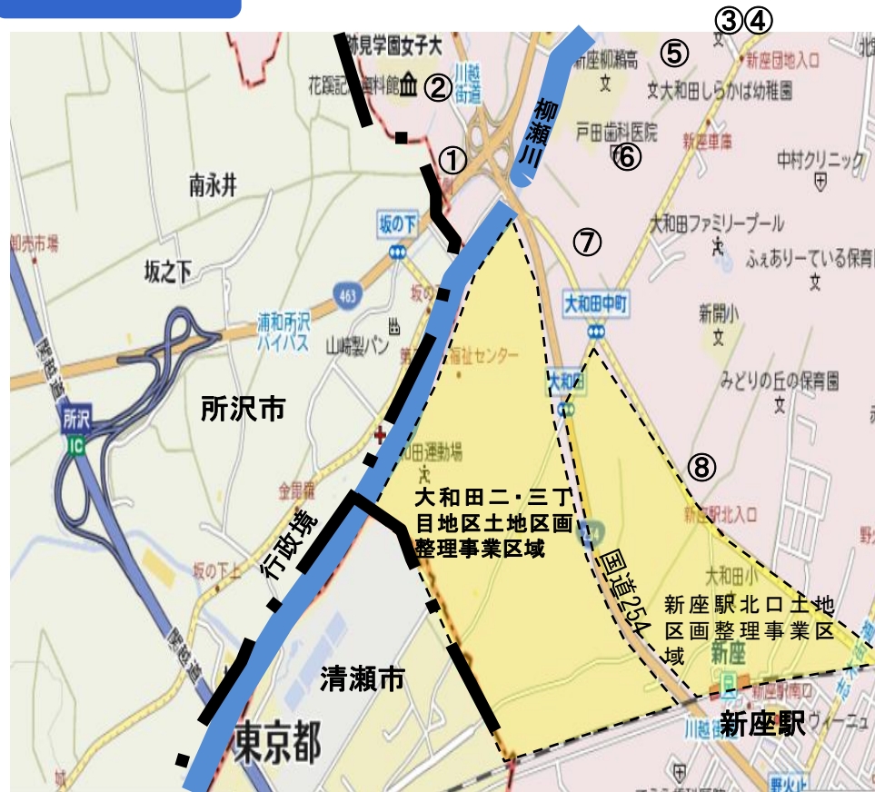
①中野の獅子舞 ②花咲記念資料館