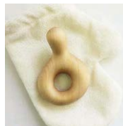
KARAKARA (lupe) ¥9,000 (税別) 9.3×7×4.2cm ヒノキ (西川材)