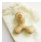
KARAKARA (muni) ¥9,000 (税別) 10×7.7×3.5cm ヒノキ (西川材)