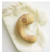
KARAKARA (coon) ¥9,000 (税別) 9.5×6.5×3.5cm ヒノキ (西川材)