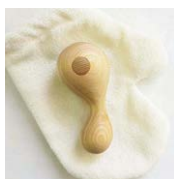
KARAKARA (noon) ¥9,000 (税別) 10.5×5×4.1cm ヒノキ (西川材)