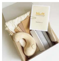
手みがきキット (noon/lupe/sax/muni/coon) 各¥5,000 (税別) ヒノキ (西川材)、サンドペーパー、 みがき台、mamamano 巾着