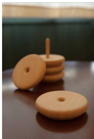
ソーサー 5枚組 ヒノキ Φ8.5cm 2,500円