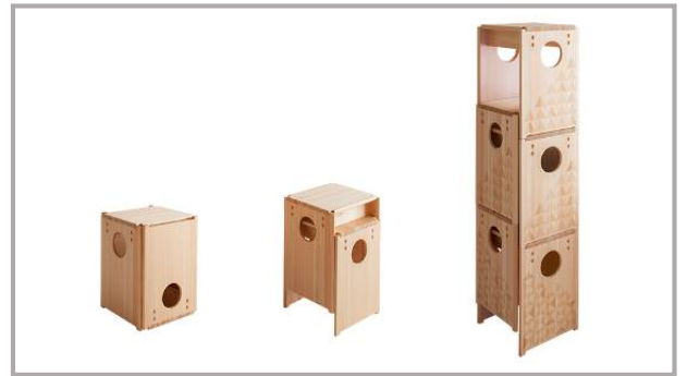
キューブ スツール Cube Stool

W32.2×D29.6×H42.1cm 無地 32,000 円 レーザー・着色あり 35,000 円