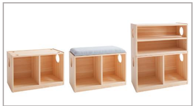
キューブ ワゴン Cube Wagon

TOP : W60×D30×H32.5cm 52,000 円 BOTTOM : W60×D30×H38cm 50,000 円