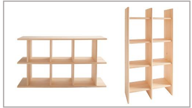
キューブ シェルフ Cube Shelf

W78 × D35 × H145cm (1段の内寸 W35 × D32 × H35cm)