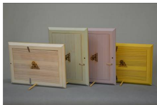
西川材ヒノキ フォトフレーム