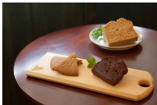
カッティングボード ヒノキ L30×W12×1.5cm 2,500円