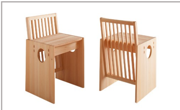
キューブ チェア Cube Chair