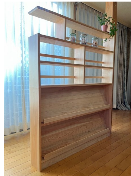
間仕切ブックシェルフ