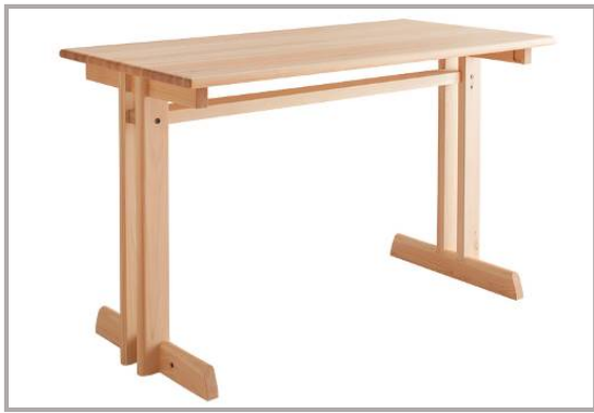
キューブ テーブル Cube Table