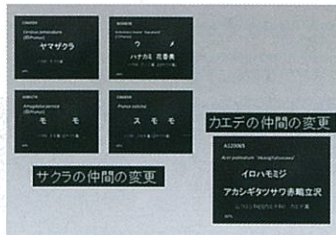
▲変更後のサクラ属・カエデ属の表示

APG分類と従来の分類(イングラ体系)との違いで、特に、私たちが日ごろ親しんでいる身近な植物2つについて説明します。