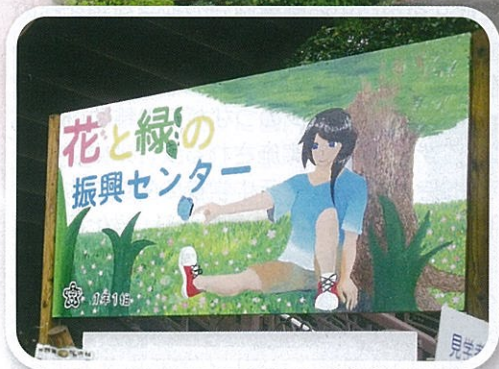
安行中生徒の皆さんによる手作り看板（東門入口）