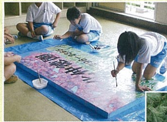
▲手作り看板作成の様子 (安行中学校)

会が事務局)。これは、植木産地の特色を活かした植木造園事業者の生産現場やモデル庭園を見学できる取組です。現在は、周辺スイーツ喫茶なども含め、40を超える事業者が参加しています。春・秋の年2回開催されるオープンガーデンでは、地元中学生が手作り看板で迎えたり、野点で持て成したりと、緑化産業振興と街興しが一体となった取組に発展しています。当センター近隣には、川口市が首都高初のハイウェイオアシス「赤山歴史自然公園(イイナパーク川口)」を建設予定(平成30年に施設の一部がオープン)で、イイナパーク→当センター→川口緑化センター(樹里安)のルート、オープンガー