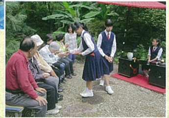
安行東中学校茶華道部▶ による野点(好樹園)

デンや地域に点在する名勝で結び、全国に発信する安行全員参加の街興しに繋げていきたいと考えています。