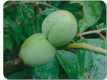
ウメ「夫婦枝垂」の実