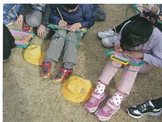
見学後、おそわったことを熱心にメモしていました

次代を担う子供たちをはじめ県民の皆様にも、園内見学を通じ花と緑に親しんでいただきたいと思います。ご来園心よりお待ちしております。