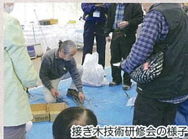
接ぎ木技術研修会の様子

他に(公財)川口緑化センターと共催で、接ぎ木などの伝統的な技術を習得する研修も行っています。開催は生産者団体や関係機関に事前にお知らせしているほか、センターホームページでもお知らせしています。ぜひご参加ください。