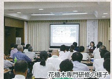
花植木専門研修の様子