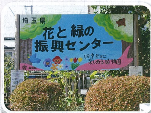
安行中生徒の皆さんによる手作り看板（正門）

センターでは新しい分類※による 樹名板改修プロジェクトに取り組み、 来園者の皆様の学習の場、 憩いの場として、一層の見本園機能の 充実を図っています。