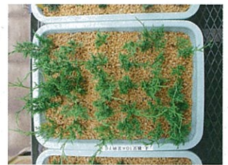
シンパク挿し木の様子

植木類の輸出拡大のためには需要的に合わせた効率的な生産が重要です。国内有数の盆栽輸出県である本県の主要品目のひとつシンパクは挿