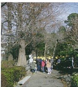
ラクウショウの木の前で説明を聞く小学生

当センターの園内は約2,000品種・約4,600本の植木類を展示し、お客様に年間を通じて緑に親しみ学んでいただく場を提供しています。団体で来園する方も少なくありませんが、地元川口市内の小学3年生の社会科見学が最も多く、昨年度は14校、約1,300人の児童・先生にご来園いただきました。歴史ある川口市の植木産業を学んでいただくとともに、四季折々の花と緑に親しんでいただこうと、小学校の見学を積極的に受入れています。児童には、安行植木産地の始まりや発展した理由などを説明した後、クラスごとに園内の見どころを案内します。芝生でお弁当をひろげる小学校もあり、子供たちの笑顔と歓声が園内に響きます。