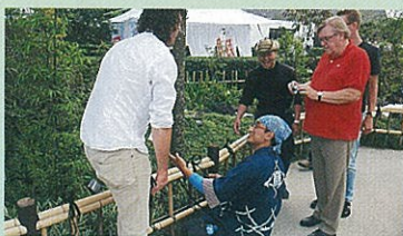
フロリアード2012 日本庭園での デモンストレーション

日本の中でも埼玉県の植木生産者の技術水準は高く、世界に誇れるもので、市場競争の中で大きな武器となります。今後とも国内だけではなく、海外も見据え、情勢を的確に捉える目と世界に通用する腕を磨き、埼玉植木を発展させましょう。