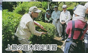
上級の庭木剪定実習