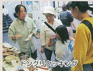
ドングリクッキング

ドングリクッキングでは、特にアクの少ないマテバシイを使ってクッキーを作り、来場者に試食していただきました。実際に試食してみると好評で、自宅で試された方もいたのではないのでしょうか。竹であそぼうでは、水でっぼう、竹馬、竹とんぼも用意し、実際に竹とんぼづくりに