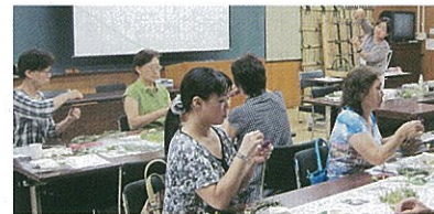
クリスマスリースづくり