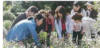
花の栽培と利用実習

一般の方を対象に、植物の植栽や花壇の花利用などの研修を、緑化講座として10回実施しています。