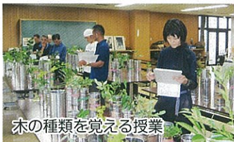
木の種類を覚える授業