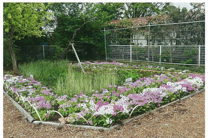
新展示園のサクラソウ

サクラソウの品種は鉢植えにして保存していますが、より多くの県民の方々に親しんでいただくため、当センター内の新展示園にも植え付けています。