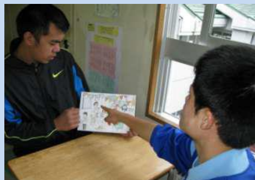
【インタビューテスト】