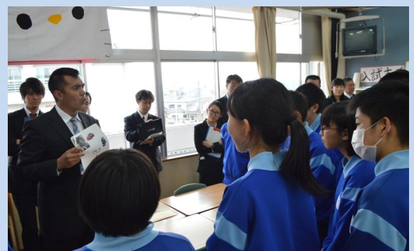
【ALT による show&tell】