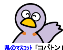
県のマスコット「コバトン」

「防犯のまちづくり出前講座」についてのご相談・お問い合わせ・お申し込みはこちらまで 埼玉県東部地域振興センター 県民生活担当 〒344-0038 春日部市大沼1-76 (電話) 048-737-1110 FAX: 048-737-9958 (電子メール) n3799863@pref.saitama.lg.jp