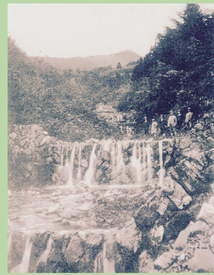
七重川(ときがわ町:当時)

砂防事業100年を節目に、今後の土砂災害への対応や防災情報のあり方、建設技術者の担い手確保等について、幅広い観点から討議を行い、県民の土砂災害への理解を深めることを目的に、現地見学、防災セミナーを実施します。