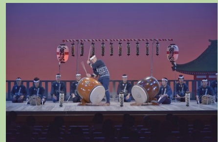
埼玉県立秩父農工科学高等学校 秩父屋台囃子保存部