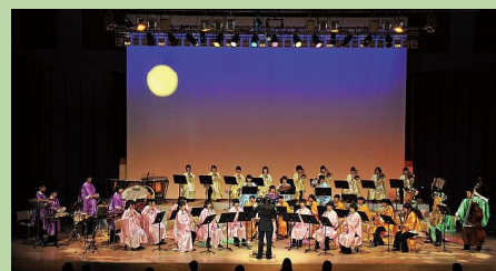
埼玉県立秩父農工科学高等学校 吹奏楽部