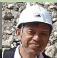
檜垣 大助氏 弘前大学農学生命 科学部教授