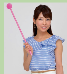
寺川 奈津美氏 気象予報士・キャスター