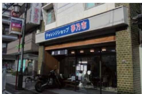
チャレンジショップの外観

川越の中心市街地では、空き店舗が商店街の連続性を阻害し、地域商業活性化の支障となっていた。この問題を解消し、さらには川越で活躍する商業者を育成するため、株式会社まちづくり川越が川越市中心市街地活性化協議会に提案し、協議会を実施主体、株式会社まちづくり川越を事務局として、本事業が実施された。