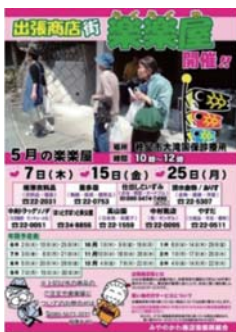
出張商店街「楽楽屋」の告知チラシ