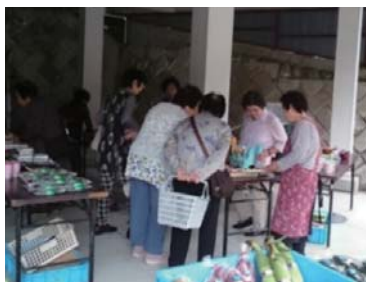
にぎわいを見せる出張商店街「楽楽屋」の様子