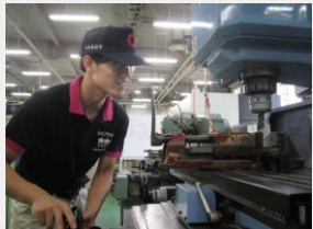
(若年者ものづくり競技大会実技課題実習)