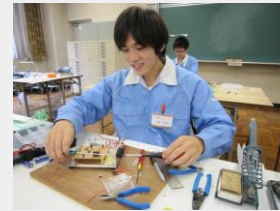
(技能検定実技課題実習)