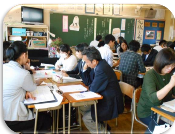
それぞれの学校での工夫や悩みも共有できた