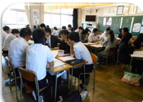
レベルの高い活発な話し合いが行なわれた