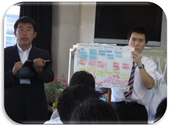
わかりやすかった各グループからの協議内容の発表