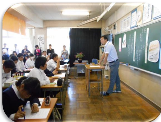
授業の終わりに熱く語る授業者