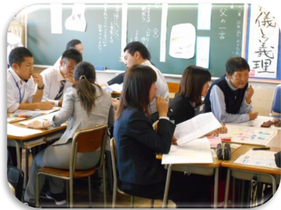
ワークショップ型グループ協議