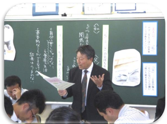
これからも魅力的な授業を創っていこうと語る指導者