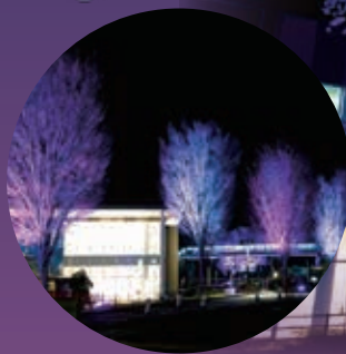
撮影場所:三井アウトレットパーク 入間