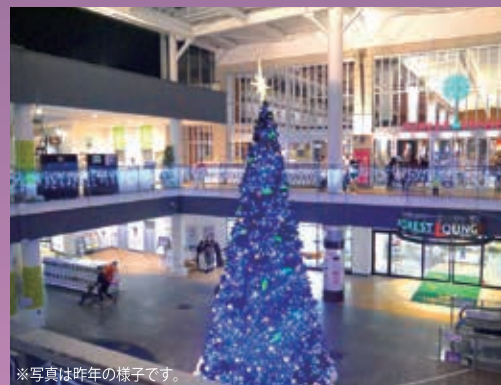
※写真は昨年の様子です。