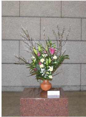
ギ、ユリ(2種)、カーネーション、スプレーマム、ハラン