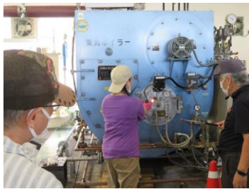
ボイラー実技講習