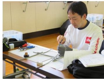
第二種電気工事士技能試験対策