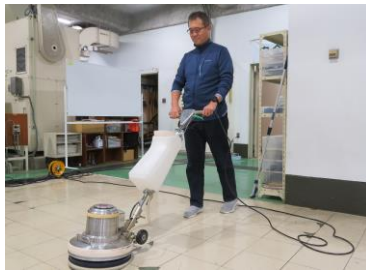
ビルクリーニング実習 (床・窓ガラス清掃)