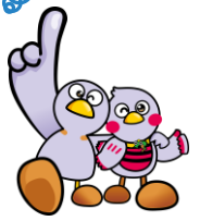
埼玉県マスコット コバトン&さいたまっちゃん