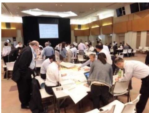
代替輸送訓練の状況