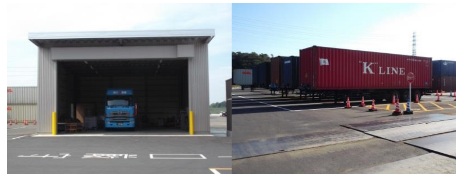
車両及びコンテナ整備場