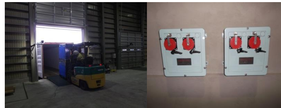
バンニング・デバンニング作業