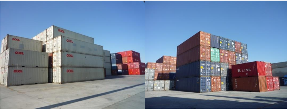
コンテナ蔵置機能 (バンプール)