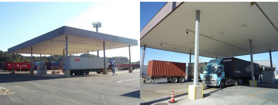
コンテナチェックゲート (IN、OUTのコンテナチェック)