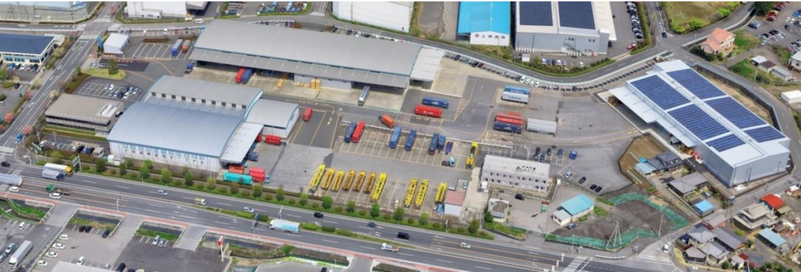
本社ターミナル：群馬県太田市清原町12-1（太田流通団地内）