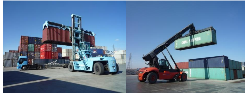
コンテナリフト作業 (荷役機械)