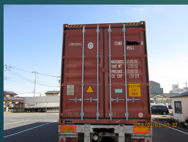
ラウンドユースコンテナ 作業チェックリスト