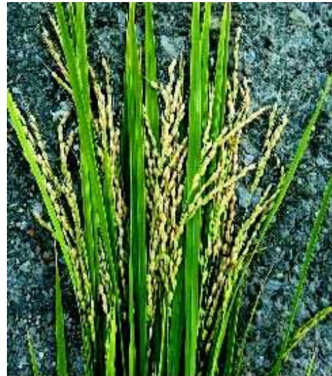
収穫適期の穂の様子