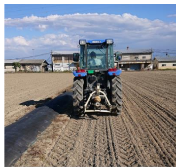
畦畔際をトラクターのタイヤで鎮圧している様子

移植栽培では、代かきの度に耕盤層の細かなヒビや亀裂が代かき後の単粒化した土で塞がれ、漏水が抑えられるが、乾田直播栽培では代かきを行わないため、連作すると耕盤層の亀裂などにより漏水しやすくなる。また、乾田直播栽培は移植水稻に比べると雑草の発生が多い傾向があり、連作はそれを助長する。そのため、乾田直播の連作は避け、移植栽培とのローテーションを行うことが望ましい。