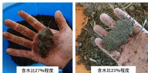
含水比がそれぞれ27%、23%の時に土を握った際の性状 (灰色低地土)

含水比は深さ15cm程度までの土壌を300gサンプリングし、105°Cで24時間乾燥させ、生土内の乾燥土と水分の割合を求めた。