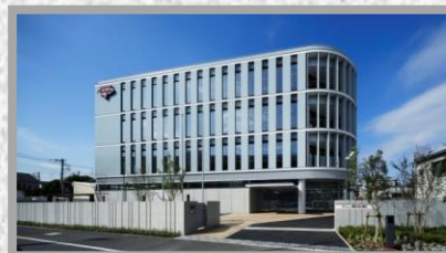
【(株)シェリエ】(上里町)