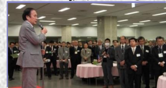
【ビジネス懇談会】（さいたま市）