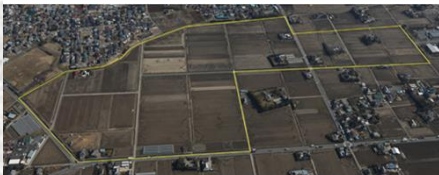
【杉戸屏風深輪地区産業団地】（杉戸町）