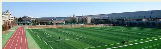
県内公立高校として初めて人工芝化した浦和南高校。早速全国大会に出場！

近年、県内でも、ラグビーやサッカーの強豪校の多くは人工芝のグラウンドに変えて、試合と同じ条件の中で練習を行っています。本校でも同様の環境を整えることで、部活動においても、さらなる活躍が期待できるものと思います。