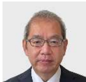
埼玉県立浦和高等学校 第32代校長