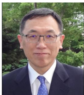
埼玉県立熊谷農業高等学校長