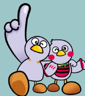
埼玉県マスコット 「コバトン」 「さいたまっち」