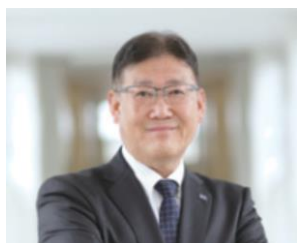
埼玉県立川口北高等学校長