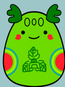
川口北高校 公式マスコット 「かわきたん」