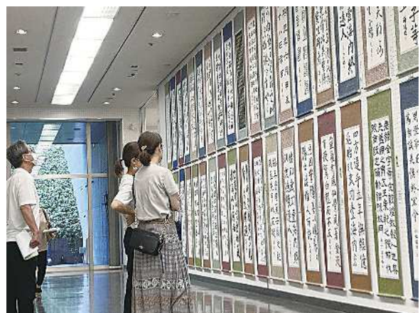
高等学校臨書の部作品