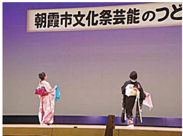
芸能のつどい 舞踊