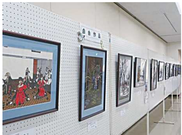
大会部門 切り絵展