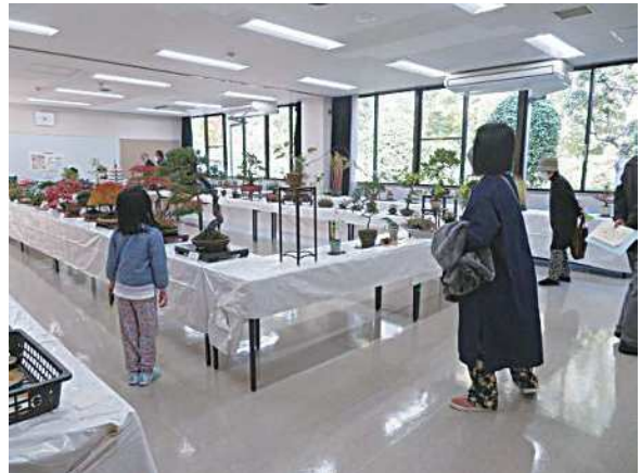
展示部門 盆栽展示

朝霞市 朝霞市教育委員会 朝霞市文化協会 埼玉県 埼玉県教育委員会 埼玉県芸術文化祭実行委員会