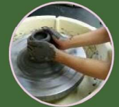
マイカップ作り（陶芸）