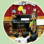
トイピアノふれあい体験

箏や三絃などの日本の伝統音楽の体験、合唱、ピアノ、弦楽器、鍵盤ハーモニカなどの音楽体験もできます。