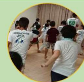
カポエイラをやってみよう！

インドネシア民話の紙芝居、ブラジルのカポエイラなど、海外の文化を体験することができます。