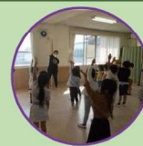
動けるからだ・表現を楽しむ（モダンダンス・創作ダンス）