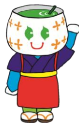
狭山特支マスコット 「茶娘 (ちゃこ) ちゃん」