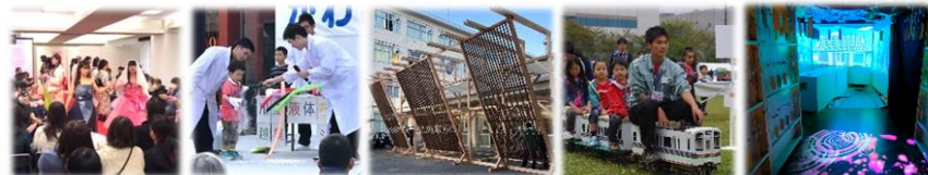
[デザイン科] アパレルショー [化学科] サイエンスショー [建築科] ウェルカムアーチ [機械科] ミニ電車 [電気科] プロジェクションマッピング