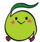
坂高マスコットキャラクター「フラップ」

【学校教育法施行規則第 103 条の 2】 高等学校における三つの方針 裏面 育成を目指す資質・能力に関する方針（グラデュエーション・ポリシー） ※ 1 教育課程の編成及び実施に関する方針（カリキュラム・ポリシー） ※ 2 入学者の受入れに関する方針（アドミッション・ポリシー）