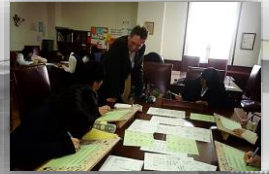
イングリッシュセミナー