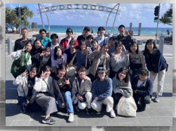
オーストラリア研修