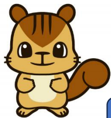
学校マスコット かわりすくん