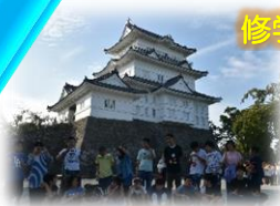
感動を共有する学校行事