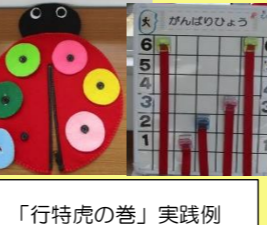
「行特虎の巻」実践例