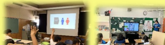
本校における生（性）に関する学習