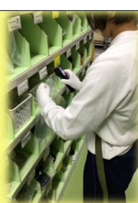
デュアルシステム（就業体験）