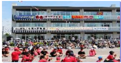
盛り上がる 運動会