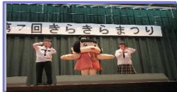
地域とともに 文化祭