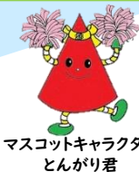
マスコットキャラクター とんがり君

自立活動の課題や内容について保護者の方と日頃から、情報交換や共通理解を図る機会を設定しています。また、必要に応じて医療機関等とも連携を図っています。