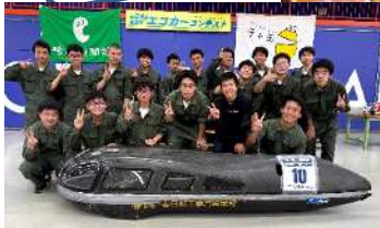
エコカーコンテスト 機械研究部