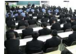
電気工事士の朝補習