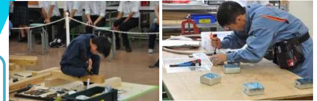
ものづくりコンテスト