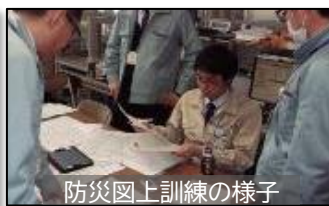
防災図上訓練の様子