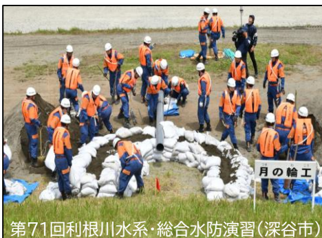
第71回利根川水系・総合水防演習(深谷市)