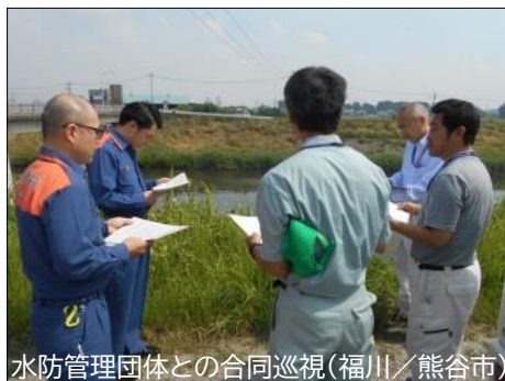
水防管理団体との合同巡視(福川/熊谷市)

関係機関と合同で重要水防箇所の点検、情報伝達訓練、水防演習を実施し、水防体制の強化を図ります。