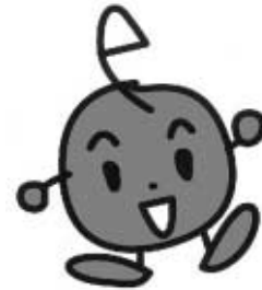
こどもエコクラブイメージキャラクター

埼玉県では、約400クラブ、7,000人もものこどもたちが登録（平成18年9月末現在）して、県内各地で環境に関する活動を行っています。