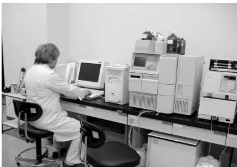
(埼玉県消費生活支援センター 商品テスト室)