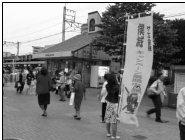
平成18年度 ヤミ金融対策街頭キャンペーン(JR浦和駅前)／埼玉県ヤミ金融対策協議会

個人や組織の保有する情報資産が漏洩、改ざん、破壊などの侵害にさらされることを防ぐしくみです。