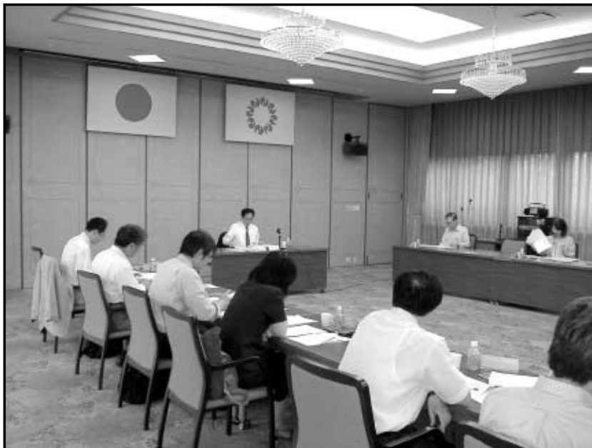
平成18年度 埼玉県消費生活審議会