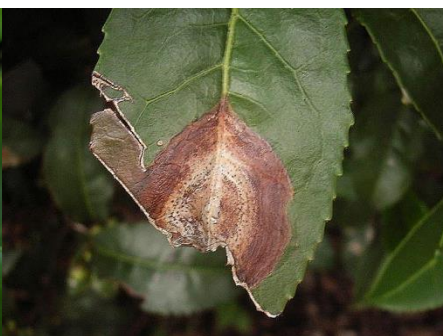
写真3 葉の中肋をはさんだ古い病斑