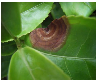
写真2 新しい典型的な病斑