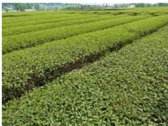
写真4 新芽の止まった被害部(手前)と健全部(奥)