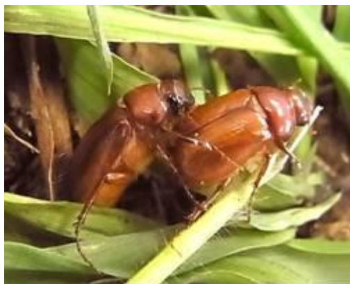
写真1 ナガチャコガネ成虫 雄(左)、雌