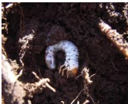
写真2 冬期も活動する3齢幼虫