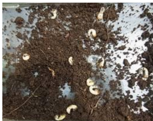
写真5 被害部の雨落ち部に多発した幼虫 5月上旬調査。10 頭程度確認される。