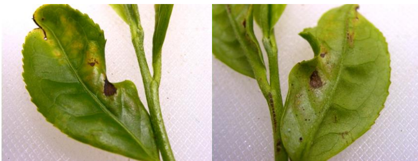
写真2 カンザワハダニによる新芽加害の様子