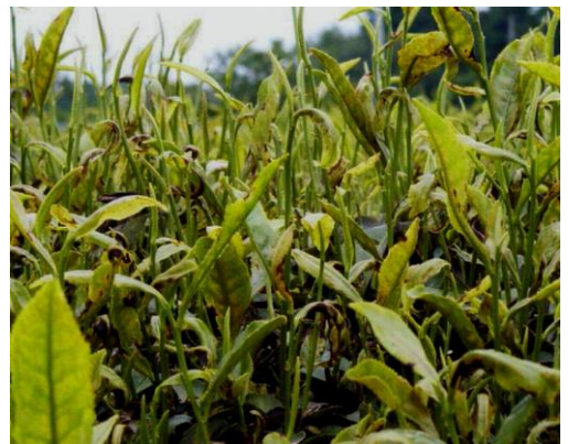
写真3 晩霜後にハダニが多発した茶園 (茶業研究所内、平成16年5月13日撮影)