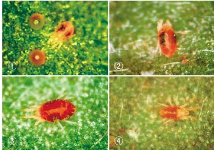
写真1 カンザワハダニの形態