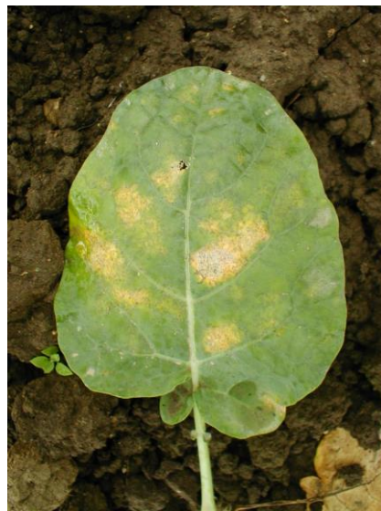
写真3 葉の発病(表面)