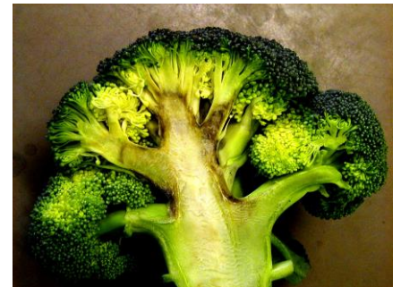
写真2 花らいの発病(花柄内部の褐変)