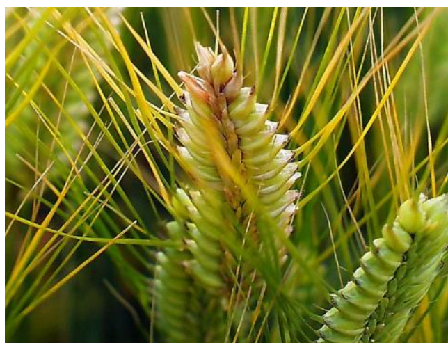
写真2 オオムギの被害穂