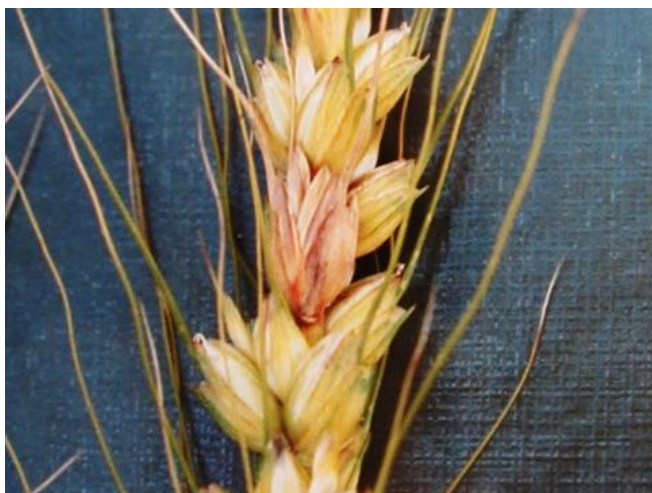
写真1 コムギの被害穂

なお、罹病子実を多く含んだものを食用や飼料に用いると、人や家畜に中毒症状を起こすことがあります。このため、食品衛生法でかび毒の基準が定められており、赤かび粒が混入すれば出荷できません。