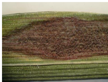
写真3 葉いもち(急性型病斑)