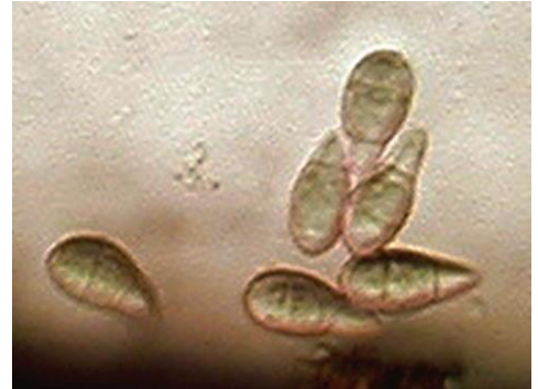
写真1 いもち病菌の分生子