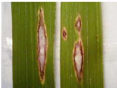
写真2 葉いもち(慢性型病斑)