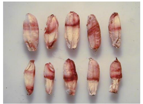
写真3 被害粒(玄米) 褐色带状斑が特徴