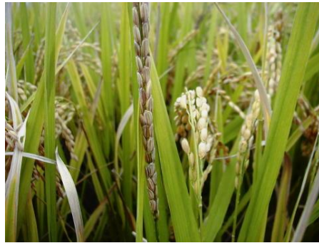
写真2 穂での発病(籾枯症) 罹病穂は直立する