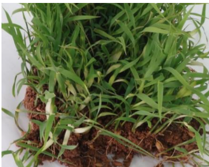
写真1 苗での発病(苗腐敗症)