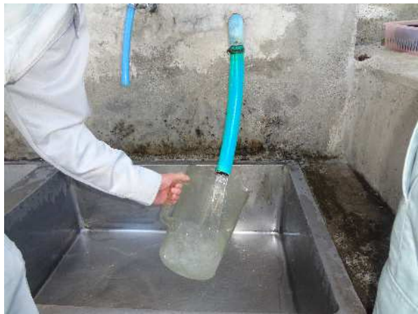
全ての蛇口を閉め、オーバーフロー専用の出口で採水及び水量の測定を行った