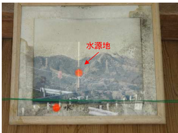
毘沙門水の水源地である白石山の案内板