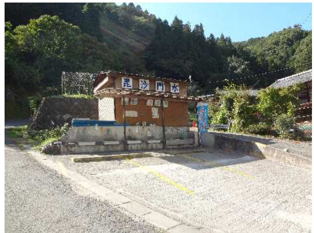
水汲み場は、きれいに整備・管理されている