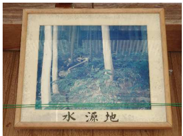
毘沙門水の水源地を撮影した案内板