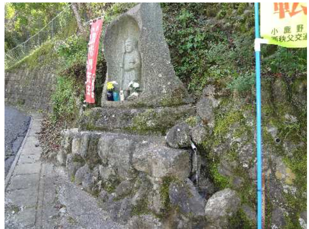
毘沙門水の近くには、毘沙門様の地蔵があり脇には、パイプから湧水が出ている