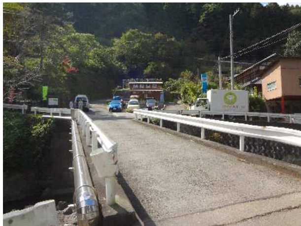
県道 282 号から橋を渡った先に湧水はある